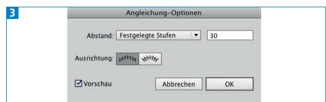
Die Dialogbox ANGLEICHUNG-OPTIONEN

4 Daher rufen Sie die ANGLEICHUNG-OPTIONEN mit einem Doppelklick auf das Angleichungs-Werkzeug auf, wählen darin FESTGELEGTE STUFEN und geben eine Anzahl ein. Diese ist abhängig von der Abbildungsgröße und dem anvisierten Produktionsverfahren. Wählen Sie die Zahl der Stufen so, dass man keine Treppen erkennt, aber gleichzeitig auch nicht zu viele Objekte erzeugt werden 3 .