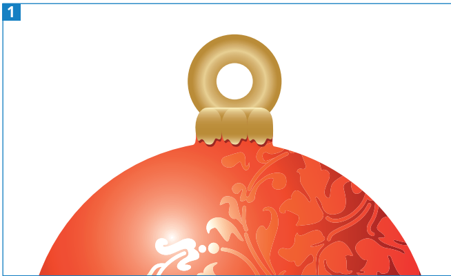
Detail der fertigen Außenkonturstanzung mit Bohrung

Stanzan oder Filigranlaser sorgen nicht nur zu Weihnachten für überraschende Effekte. Das Erstellen eines Pfads für eine Konturstanzung ist recht einfach, wie sich am Beispiel eines Anhängers zeigt.