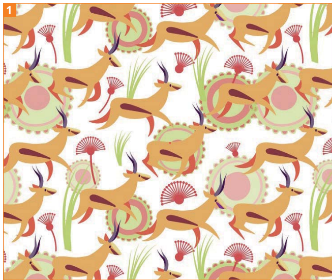
Antilopenmuster in reduzierter Umsetzung