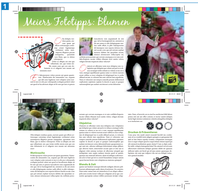
Dieser Flyer soll minimal bearbeitet und wieder gedruckt werden.

Ein PDF kann man in Illustrator auf zwei Arten verwenden: Man kann es platzieren (verknüpfen) oder direkt öffnen (in der Wirkung entspricht dies dem Einbetten beim Verknüpfen). Auch wenn Illustrator inzwischen mehrere Zeichenflächen in einer Datei haben kann, wird von mehrseitigen PDF-Dateien je Importvorgang (d.h. sowohl beim Platzieren als auch beim Öffnen) immer nur eine Seite importiert.