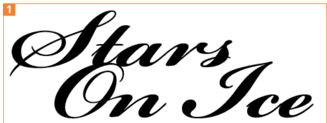
Der Text wurde hier in »Bickham Script Pro Bold« formatiert. Eine fette Schrift ist für diesen Effekt gut geeignet.

1 Bevor Sie die Pinselgrundform zeichnen, setzen Sie den Text in der Schriftart und -größe, die Sie später benötigen 1 .