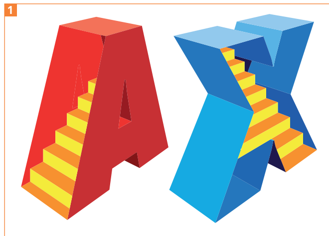
Treppen in Buchstaben: Beim X habe ich den Innenraum »unabhängig« von der Buchstabenform gestaltet – er ignoriert die Schrägungen –, was etwas surreal wirkt.

Je nachdem, wie Sie die Treppe im Buchstaben anordnen, verhält sich der Schwierigkeitsgrad der Konstruktion 1 .