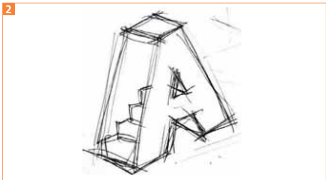
Die Skizze für das A

1 Sie können auf der Basis der Skizze arbeiten, die Sie auf der CD-ROM finden: Platzieren Sie diese Skizze »A-TREPPE.JPG« in einer neuen Illustrator-Datei 2 .