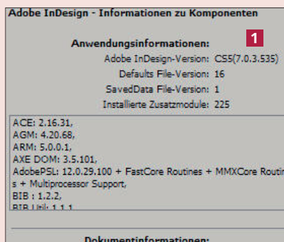
Die ganz genaue Version dieses InDesign: 7.0.3, Build-Nummer 535

Möchten Sie das Update ausführen, so öffnet sich der »Adobe Application Manager« 2 . Über