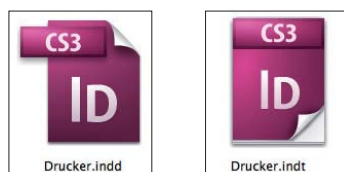
Abb. 3 Vorlagen (rechts) bekommen ein anderes Icon als normale InDesign-Dokumente (links) und mit »indt« auch eine abweichende Dateierdung.

Beim Speichern von InDesign-Dokumenten können Sie als Format 5 auch »InDesign-Vorlage« wählen. Vorlagen sind »Musterdokumente«, von denen beim Öffnen automatisch eine Kopie erstellt und statt des Originals diese Kopie geöffnet wird. Vorlagen sind besonders sinnvoll, wenn Sie ein Produkt haben, das regelmäßig neu erstellt werden muss, wie z. B. eine Zeitschrift. Sie können ein Dokument mit allen wichtigen Layout-Elementen, Formaten, Farben, Musterseiten etc. anlegen und es dann als Vorlage abspeichern. Beim Öffnen dieser Vorlage entsteht automatisch eine Kopie, in der Sie nun nur noch die Texte und Bilder platzieren müssen. Das Original bleibt unverändert und steht für die nächste Ausgabe wieder »sauber« zur Verfügung.