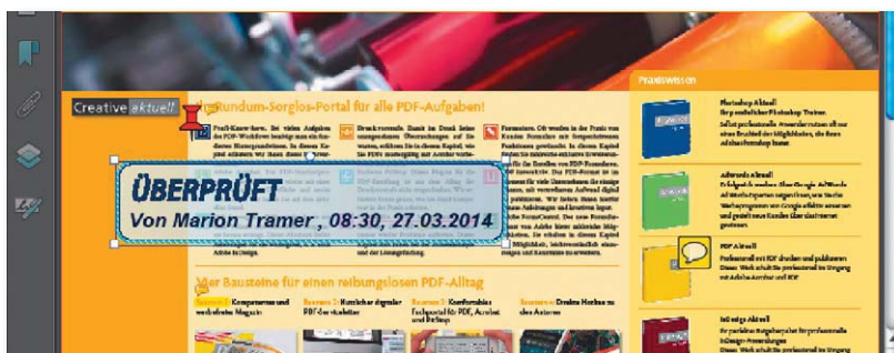
Bei einem dynamischen Stempel werden der Anmeldenname sowie die Uhrzeit- und das Datum, zu denen der Stempel im PDF-Dokument aufgebracht wurde, angezeigt.

ACROBAT liefert auch einen Satz dynamischer Stempel mit. Diese dynamischen Stempel werden automatisch mit dem Anmeldenamen des Anwenders sowie einer Zeit- und Datumsangabe versehen.