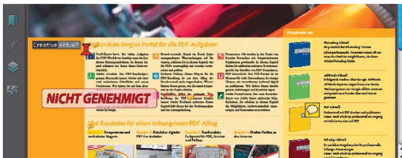
Ein statischer Stempel wird unverändert im PDF-Dokument angebracht.

Das STEMPEL-WERKZEUG bietet Ihnen die Möglichkeit, mitgelieferte oder eigene Symbole, die im PDF-Format vorliegen, auf der Seite aufzubringen. Bei den meisten Stempeln handelt es sich um statische Stempel, d. h., sie sind unveränderlich in den Informationen, die auf die PDF-Seite aufgebracht werden.