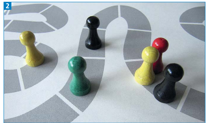
Austesten des Spielfpads in Originalgröße

Denken Sie daran, dass in einem Feld auch einmal mehrere Spielsteine stehen müssen. Legen Sie den Pfad daher nicht zu schmal an. Wenn Sie sich nicht sicher sind, drucken Sie den Spielplan in Originalgröße aus und testen die Größe der Felder mit Spielfiguren 2 .