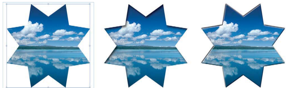
Abb. 2 Verschiedene Objekteffekte an einem Rahmen

Stanzungen (Effekt SCHATTEN NACH INNEN oder Effekt ABGEFLACHTE KANTE UND RELIEF) versehen, um sie noch attraktiver zu gestalten.