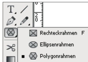
Abb. 1 Die Rahmenwerkzeuge in InDesign

Dazu dienen sowohl die InDesign-Rahmen- und Zeichenwerkzeuge als auch beispielsweise aus Illustrator kopierte und in das Layout eingefügte Vektorformen.