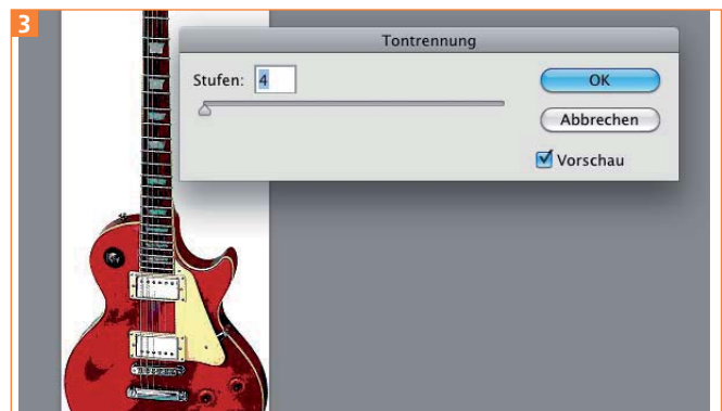
Tontrennung in Photoshop

2 Wenden Sie BILD → KORREKTUREN → TONTRENNUNG an. Reduzieren Sie die STUFEN auf etwa 4, das ergibt eine etwas größere Anzahl an Farbtönen im Bild 3 .