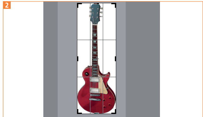
Beschneiden des Motivs

1 Beschneiden Sie das Bild mit einem möglichst engen Auswahlrechteck nur um das gewünschte Objekt. Je weniger unnötige Bildpixel Sie jetzt bearbeiten und später in ein Mosaik umwandeln, umso schneller geht es 2 .