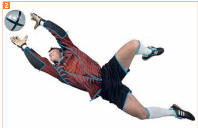
Unterteilungen der Bereiche im Foto, die Sie in unterschiedlichen Farben füllen wollen. Es werden nur wenige benötigt, denn die Grafik soll sehr plakativ wirken.

3 Anschließend erstellen Sie eine neue Ebene und zeichnen darin Pfade, um einige Bereiche des Fußballers aufzuteilen, die später mit unterschiedlichen Farben gefüllt werden 2 .