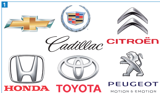
Einige Beispiele von Automarken

Das typische Autologo ist durch ein »Bevel« leicht erhaben dargestellt und glänzt metallisch 1 . Diesen Look wollen wir hier für einen beliebigen Schriftzug anwenden. Anders als Photoshop oder InDesign besitzt Illustrator keinen entsprechenden Effekt, sodass es nicht ganz so einfach ist, so etwas zu erstellen.