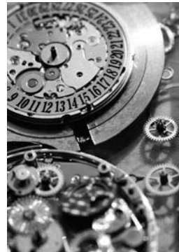
Graustufenbild - TIFF mit Profil

Mit der aktuellen Erweiterung erhalten Sie ein Kapitel über die Color-Management-Einstellungen in QuarkXPress 7 . Doch auch wenn Sie die Color-Management-Einstellungen korrekt vornehmen, kann es in der aktuellen Version bei der Ausgabe zu Problemen kommen – hier ein Praxisbeispiel, das als Graustufendokument ausgegeben werden sollte –, die mit dem nächsten Update von QuarkXPress 7 als auch mit der neuen Version QuarkXPress 8 behoben sein sollen. Bei dem aktuellen Fallbeispiel wurde ein QuarkXPress-Dokument erstellt, in das Bilder im Graustufenfarbraum importiert und lediglich schwarzer Text eingegeben wurden.