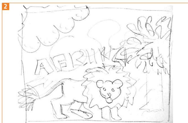
Die Skizze für die Illustration

Auch dieses Projekt beginnt mit einer Skizze. In diesem Fall ist es eine eher grobe Ausführung 2 .