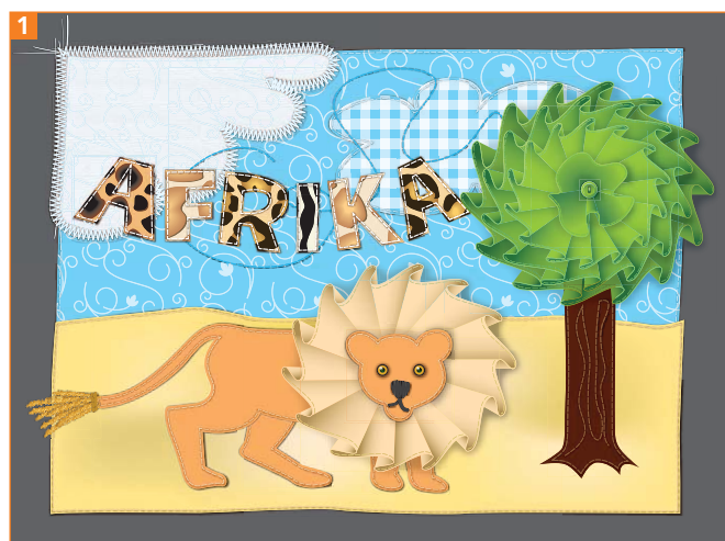
Das Ergebnis dieses Beitrags: ein genähtes Bild

Einen Handarbeitslook anzudeuten, ist einfach, es reichen wenige Signale, um die Assoziation hervorzurufen. Sehen wir uns einige Techniken anhand einer illustrierten Patchwork-Arbeit an 1 .