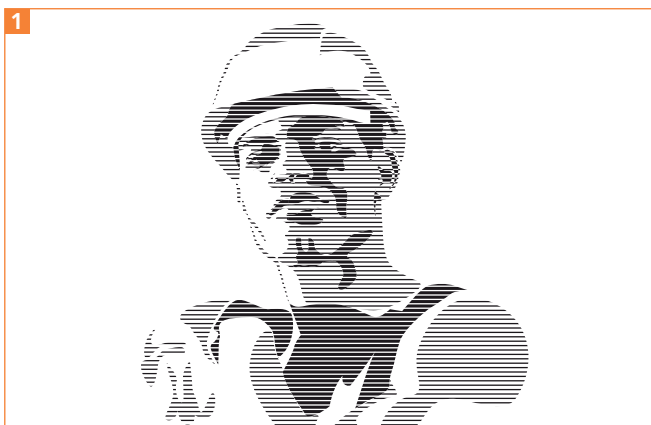
Mit Schraffuren können auch Helligkeitsstufen erzeugt werden (die Fotovorlage aus der MEV-Bibliothek finden Sie wie die Probedateien auf der CD-ROM).

Anstatt Zeichnungen, die auf der Methode der Tontrennung beruhen, mit durchgefärbten Füllungen zu versehen, können Sie auch Schraffuren verwenden.