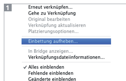
EINBETTUNG AUFHEBEN im Menü des Verknüpfungen-Bedienfelds

1 Aktivieren Sie ein eingebettetes Bild und klicken Sie entweder auf den Button EINBETTUNG AUFHEBEN im Steuerungsbedienfeld 2 oder rufen Sie den gleichnamigen Befehl aus dem Menü des Verknüpfungen-Bedienfelds auf 1 .