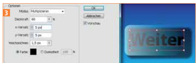
Der hinzugefügte Schlagschatten scheint durch die transparente Fläche hindurch.

4 Im nächsten Schritt ordnen Sie den Schlagschatten zu. Die Fläche sollte noch selektiert sein. Wählen Sie mit dem Button NEUEN EFFEKT HINZUFÜGEN → STILISIERUNGSFILTER → SCHLAGSCHATTEN . Die Optionen können Sie ebenfalls wie gezeigt einstellen 3 .