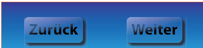
Transparente Buttons mit Schlagschatten als Ziel der Übung

Im Screendesign der letzten Jahre haben sich unter anderem die »glossy buttons« etabliert. Um flexibel zu sein, sollten sich derartige Buttons auch an die Breite des Inhalts anpassen. Damit sind solche Designs vorzugsweise über das Aussehen umzusetzen. Kommen zusätzliche Anforderungen in Form eines Schlagschattens bei durchscheinender Hintergrundfarbe hinzu, können Sie jedoch nicht mehr mit dem Pathfinder(-Effekt) arbeiten. Wie Sie dennoch Flexibilität und die gewünschte Funktionalität zusammenbringen, erfahren Sie in diesem Workshop.