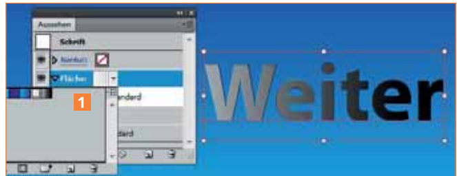
Die neu angelegte Fläche mit dem weißen Farbverlauf

2 Im Fuß des Bedienfelds klicken Sie auf NEUE FLÄCHE HINZUFÜGEN oder wählen diesen Befehl aus dem Bedienfeldmenü, um eine weitere Fläche zu erzeugen. Als Flächenfarbe vergeben Sie den Farbverlauf »Weiß Transparent« 1 .