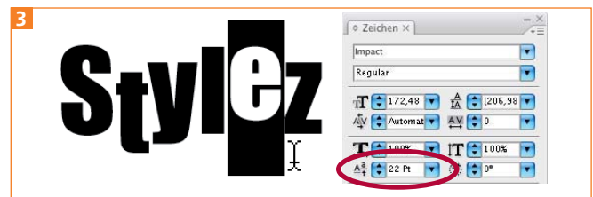
Textformatierung: Verschieben der Grundlinie einzelner Zeichen

3 Um wie im Beispiel ein Zeichen über oder unter die Grundlinie zu verschieben, aktivieren Sie das betreffende Zeichen mit dem Text-Cursor und geben einen positiven bzw. negativen Wert unter GRUNDLINIENVERSATZ EINSTELLEN ein 3 .