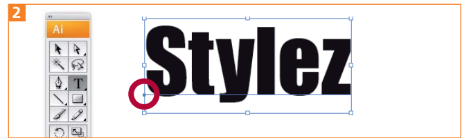
Ein Klick mit dem Text-Werkzeug auf die Zeichenfläche erzeugt einen Punkttext, erkennbar an dem kleinen Punkt (Kreis).

2 Geben Sie den gewünschten Text ein und weisen Sie ihm eine Schriftart und -größe zu. Die in unserem Beispiel verwendete Schriftart ist die »IMPACT« 2 .