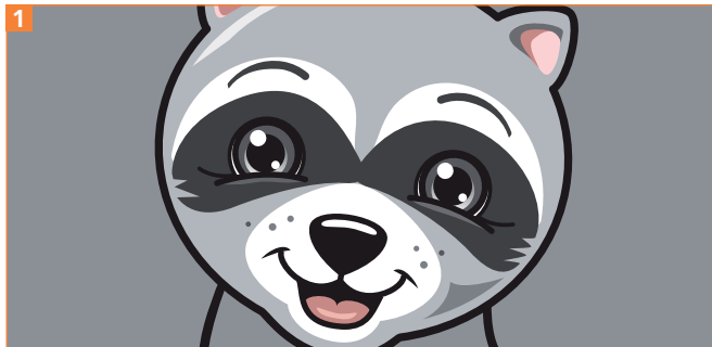
1 Ein Lächeln über das ganze Gesicht bezieht Mund, Augen und Stirn mit ein.

Die Ebenentechnik ermöglicht ein einfaches Entwickeln verschiedener mimischer Ausdrucksweisen aus Grundformen.