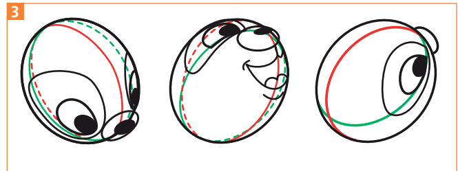
3 Auch bei der vertikalen Drehung gelten die gleichen Gesetze für die Verkürzungen.

Wenn Sie nun einige Versionen dieser Ansichten während der Drehung zeichnen, erhalten Sie eine Animation des Kopfes.