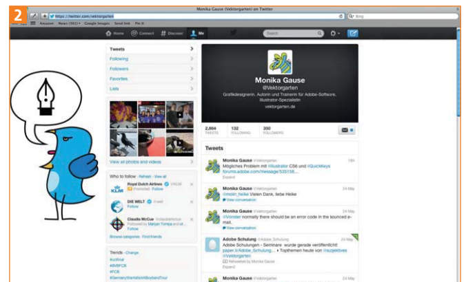
Der Twitter-Vogel auf meiner Profseite

Für mein Twitter-Profil habe ich schon seit Längerem eine eigene Interpretation des Twitter-Vogel gezeichnet. Was liegt näher, als diesen Vogel zu animieren und ihm dabei meine letzten Tweets (als Tweet wird eine der 140-Zeichen-Veröffentlichungen bei Twitter bezeichnet) in einer Endloschleife »in den Schnabel zu legen« 2 ?